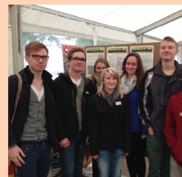
Europaschule Gymnasium Gommern auf dem Landestag

Abiturient vom Kurfürst-Johann-Friedrich-Gymnasium Wolfenbüttel Mitglied Aktionsgruppe „SOZIAL“