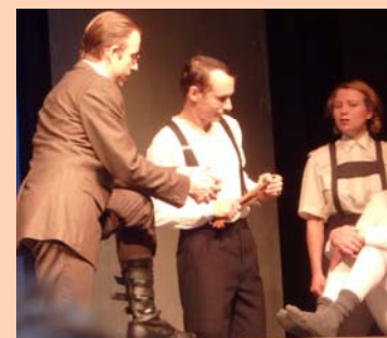
„Mein Kampf“ am 10.10. Aschersleben